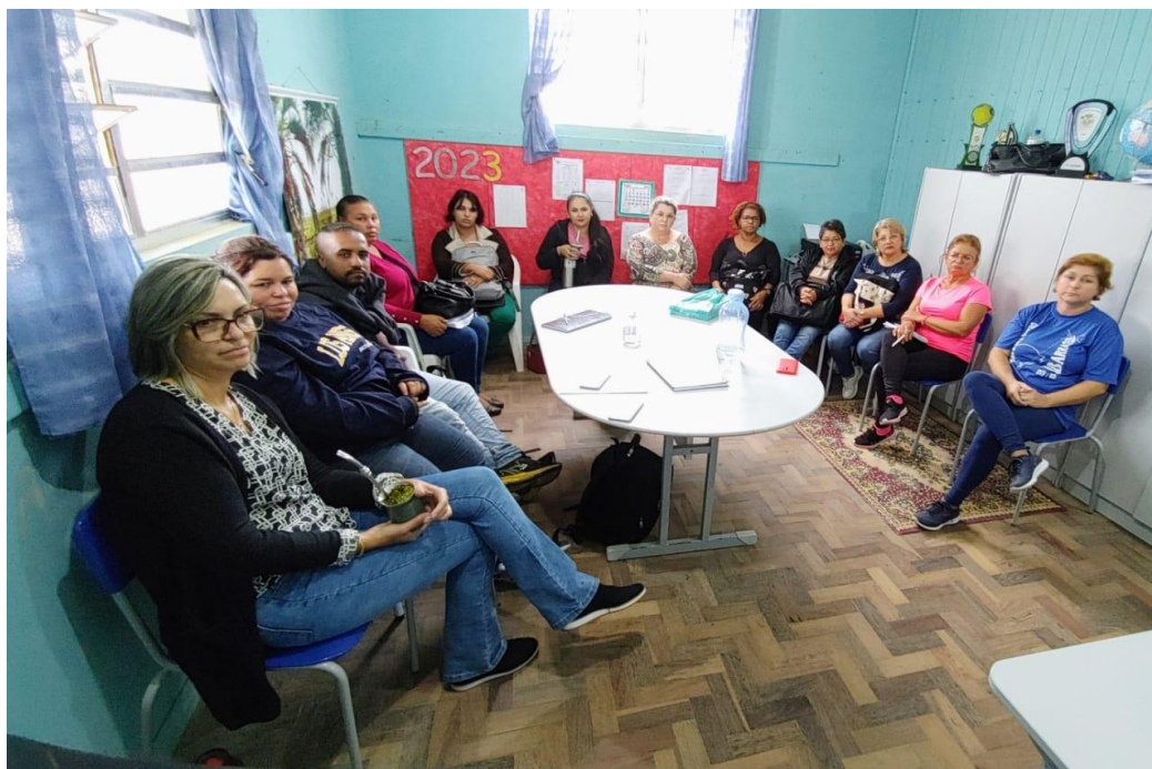
Roda de conversa com os professores da escola