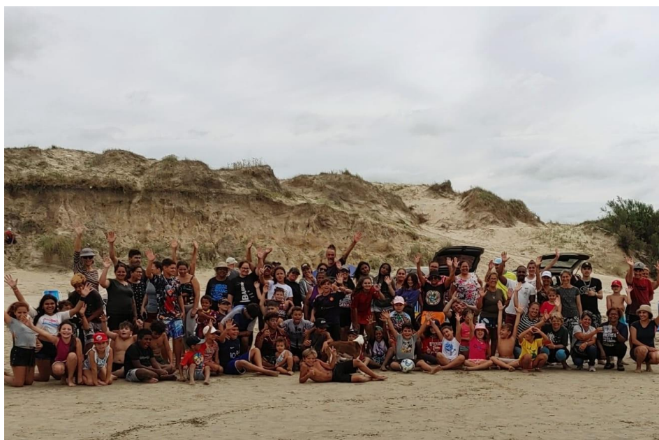
Comunidade escolar na data de comemoração do aniversário da escola

Um dia muito especial, foi o dia do aniversário da escola, 22 de março de 2023, onde fui convidada a participar de um momento de integração da escola com a comunidade, uma confraternização que contou com a presença de alunos, pais e familiares, professores e demais profissionais colaboradores da instituição de ensino e simpatizantes da escola da Barra. Foi um lindo dia de sol radiante e mar de espuma branquinha, repleto de sorrisos e muita diversão, conversa boa, roda de chimarrão, pesca, piquenique, jogos de bola, fogo de chão, churrasco de linguiça e até concurso de castelo de areia. Tentei ficar apenas observando, mas o convívio é tão natural e contagiante, que logo me vi participando com a comunidade escolar, e até fui chamada de "sora", experiência gratificante e certamente inesquecível.