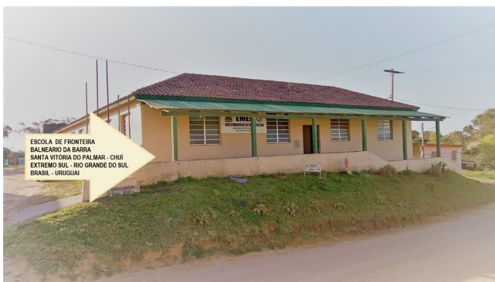
Escola José Bernardino de Souza Castro

O passo inicial foi dado no dia 24 de fevereiro de 2023, dia de conhecer um pouco mais o objeto de pesquisa, a Escola Municipal de Ensino Fundamental José Bernardino de Souza Castro, neste dia foi entregue a carta de apresentação para a diretora da instituição. Foi exposta a ideia da pesquisa para a mesma e para a coordenadora pedagógica, a qual foi acolhida e elogiada por ambas.